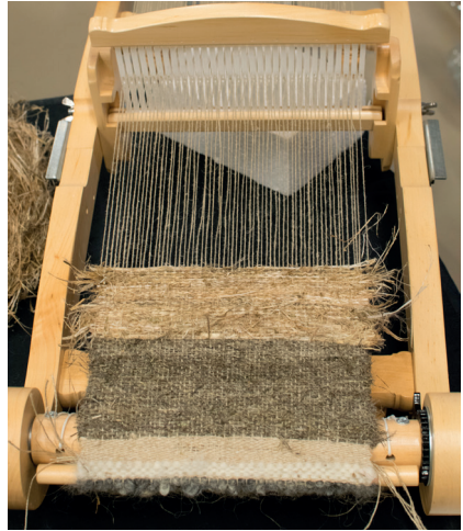
Fibre organique: ici l'ortie.