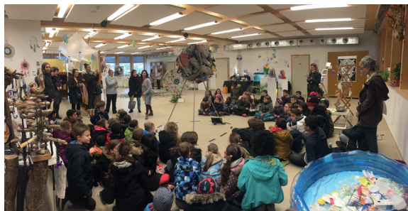
L'exposition « Nous sommes nature... plastique »

Mention pour la Bourse cantonale du développement durable, édition 2017 pour le programme « Sensibilise ».