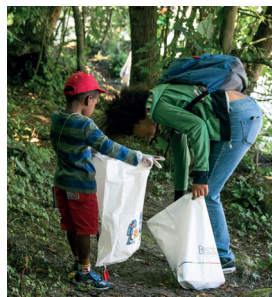
Le nettoyage de l'Arve