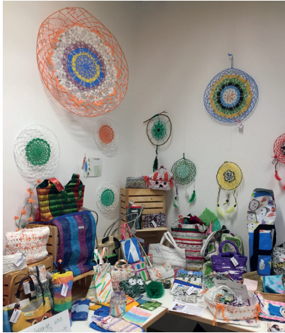
Photos des créations de l'association

Le Bureau de l'Intégration des Étrangers (BIE) Le Département de l'Instruction Publique (DIP) Les communes : Confignon, Menier, Veyrier, Onex, Carouge Les fondations privées dont la Loterie Romande et la Fondation Sandoz La Banque Cantonale Genevoise Donatrices et donateurs anonymes ou privés.